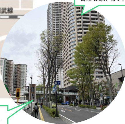
こちらのマンションの 2階が会場ホールです