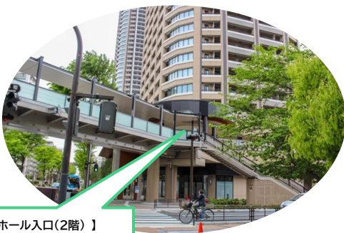
【ホール入口(2階)】 1階のマンション入口からは ホールに入れません