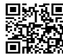
技能者マイページ