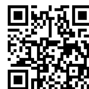
認定補聴器技能者 養成事業システムページ